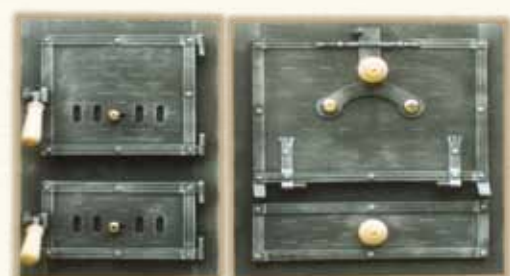
TOPNÝ ŠTÍT 2001 TROUBA S LAMELOU 2104