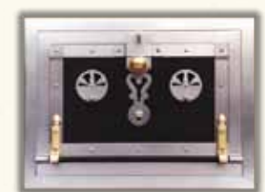
PEČÍČÍ TROUBA VYNDÁVACÍ 4210