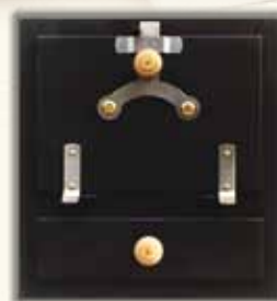
TROUBA S LAMELOU 1101