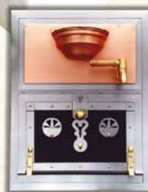
PEČÍČÍ TROUBA S MĚDĚNCEM 4225