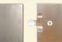
MODENA SE ŠLICI