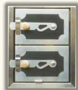
TOPNÝ ŠTÍT 3001