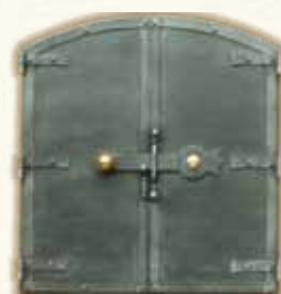
DVOUKŘÍDLÁ OBLOUKOVÁ DVÍRKA 2304