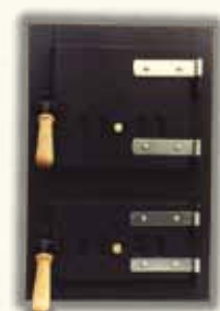
TOPNÝ ŠTÍT 1001