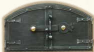
OHŘÍVACÍ TROUBA 2502