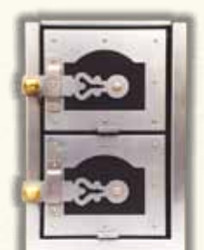
TOPNÝ ŠTÍT 4001